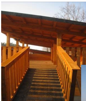
La nuova stalla con spazi per le attività